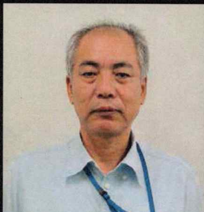
藤谷 哲男 ふじたに てつお

1962年生まれ、兵庫県出身。個性派俳優として舞台、映画、テレビのみならず、バラエティ番組やナレーションなど幅広く活躍中。芸能界有数の鉄道好きでも知られる。劇団の旅公演などで鉄道に親しんでいたこともあり、30代後半から乗り鉄になり、ほぼ全国のJR路線を制覇。NHK-BSにて放送中の「六角精児の呑み鉄本線・日本旅」にも出演。鉄道の中で酒を楽しむ、風景を楽しむ、その土地ならではの食と旅先での出会いを肴に酒を楽しむ「飲み鉄」という新しいジャンルを切り開いた。その他「呑み鉄」の旅、「六角精児 鉄旅の流儀」など、鉄道関連の著書も上梓している。